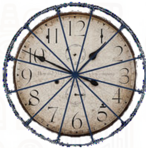
360^\circ kruh rozdelený na 12 častí

Kalendár pochádza zo slova „calendae“ a znamená: kniha výberu daní. Jeho pôvod pochádza z roku 3 113 pred Kristom, z babylonských čias, splodili ho Egypťania, Babylončania a Sumeri. Na stavbu vychádzali zo slnečného cyklu (365 dní), použili kruh 360^\circ (miera priestoru), rozdelili ho na 12 častí po 30^\circ a pridali 5.